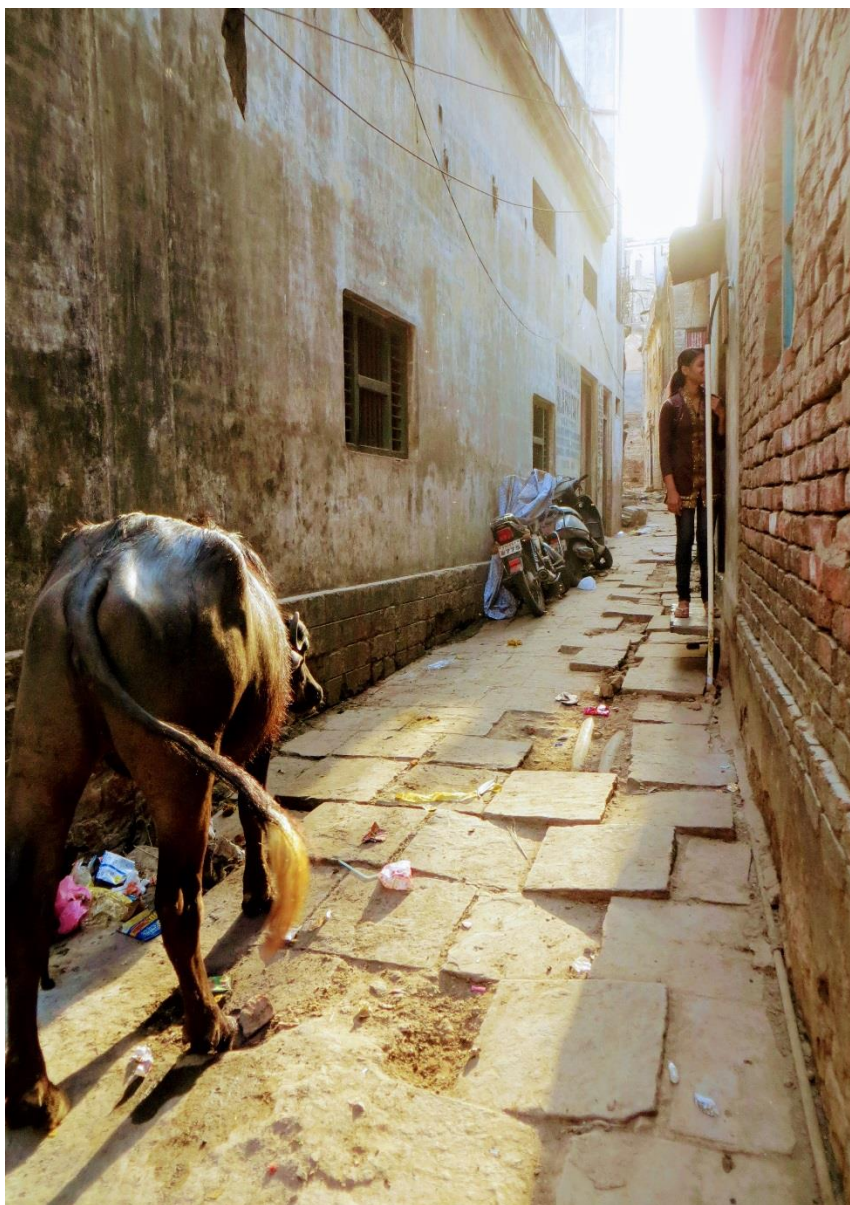
V uličkách Varanasi (Janka Onufráková)

kvetov, vône, chaos (šialený, no organizovaný), hluč (predstavte si, že stojíte u nás na veľkej križovatke, všetky autá dostanú naraz zelenú, vyrútia sa, začnú trúbiť a neprestanú, až kým neprídu do cieľa), kravy, ťavy, kone, capkovia s rozprávkovo zatočenými rohami, ovce, kozy a túlavé psy (všetky tieto zvery popri Vás v tých úzkych uličkách - kto má prednosť :-)?), byvoly chladiace sa v Gange (fakt horúco, my sme mali 45 stupňov a celý deň sme chodili, v Dillí detto a raz sme mali až 48 stupňov a v Agre nám z horúčavy odpadla jedna účastníčka expedície), neuveriteľný spirit, množstvo filozofií a náboženstiev (hinduistická majorita, no aj džinisti, sikhovia, budhisti, kresťania a moslimovia), sádhuvovia (svätí muži), vôňa kadidla, plavba loďkou po Gange (akoby plavba do minulosti), západ slnka nad Gangou, večerný hinduistický ceremoniál Ganga Aarti ("Zatváranie Gangy" - deje sa každý večer a chodia naň davy veriacich - pre mňa jeden z najimpresívnejších zážitkov vôbec) a s ním spojená Ganga Pudža (veselá oslava hinduistických bohov s hudbou, horiacimi ohňami a tancom)! Bola to sila, keď sa pri západe slnka začal ceremoniál a ja som nechápajúc pozerala zo svojho člnka, čo sa deje ... kto nezažil, nevie o čom píšem, ale kto zažil, vie, že na také momenty sa nezabúda!