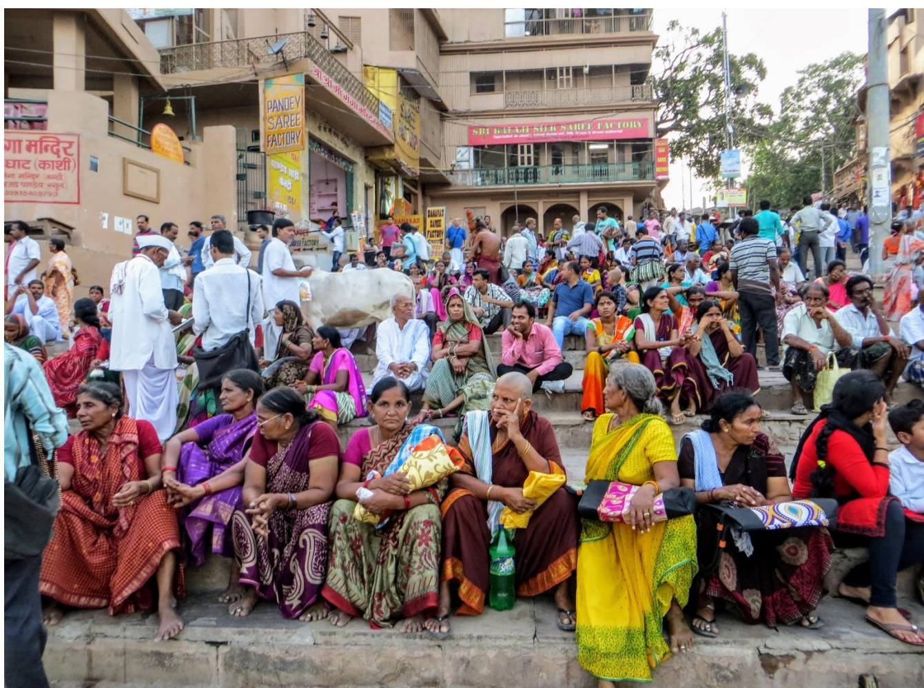
Ľudia vo Varanasi. Všade ich je veľa, nikdy nikde nebudete sami