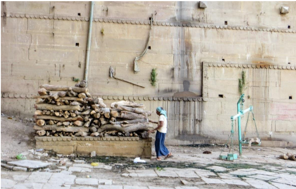
Nedotknuteľný pri vážení dreva určeného na spaľovanie mŕtvych (Janka Onufráková)