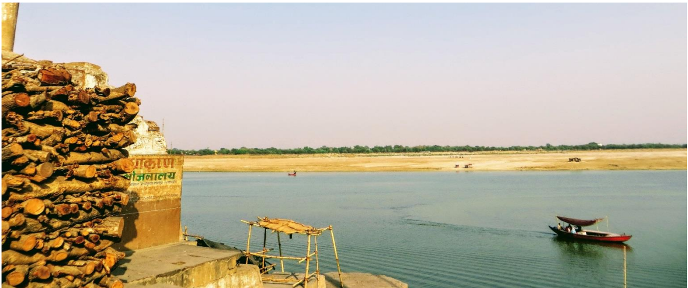
Rieka Ganga pri začínajúcom západe slnka a drevo na spaľovanie mŕtvych (Janka Onufráková)

Rieka Ganga nie je pre hinduistov obyčajná rieka. Predstavuje telo bohyně, ktoré ozdravuje, dodáva životnú silu a otvára čakry. Hinduisti veria, že kúpeľ v nej očistí človeka od hriechov.