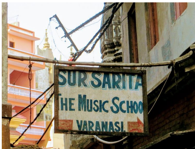
Jedna z mnohých hudobných škôl vo Varanasi

Keď som si prečítala jeden článok označujúci Varanasi za mesto smrti, prišlo mi to scestné. Je pravda, že do Varanasi prichádzajú chorí a starí, aby tu dožili a boli spálení, no takých ľudí nevidíte a samotné spaľovanie sa deje len na určených ghátoch (tam áno, tam je smrť všadeprítomná). Pre hinduistov je Varanasi šťastným miestom, lebo veria, že ak práve tu budú spoplnení, dosiahnu vytúženú cestu do večnosti a radostné vykúpenie z kolobehu reinkarnácií ( mokši ). Spaľovanie je len jednou stránkou Varanasi, navyše prirodzenou pre hinduistov. V mojom ponímaní je to mesto života, radosti, osláv, farieb a hudby. Je všeobecne vnímané ako významné kultúrne centrum Indie. Žili tu a žijú tu mnohí indickí filozofovia, básnici a hudobníci.