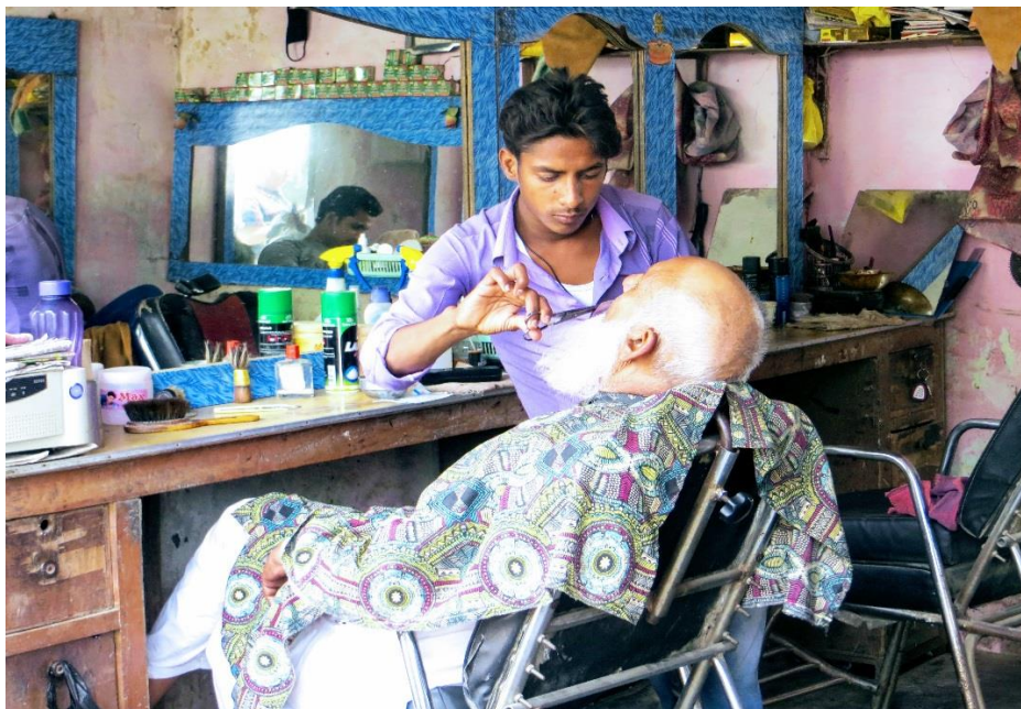
Indickí holiči a kaderníci majú dobré meno (Janka Onufráková)

Pokiaľ ide o služby, Indovia sú vychýrení kaderníci a holiči.