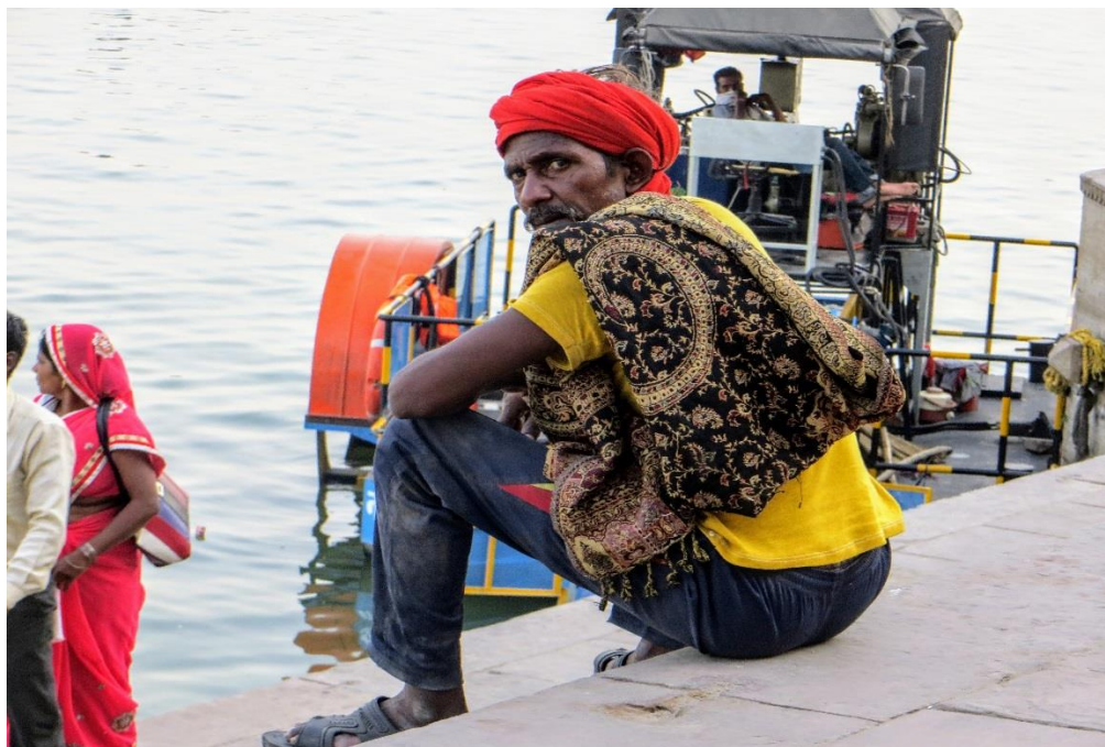
Ľudia vo Varanasi. Potulujem sa pri západe slnka popri Gange (Janka Onufráková)

V Indii prevládajú a dominujú muži, sú uprednostňovaní aj pokiaľ ide o novonarodené deti. Bežným, smutným javom je tu zabíjanie novonarodených dievčatiek.