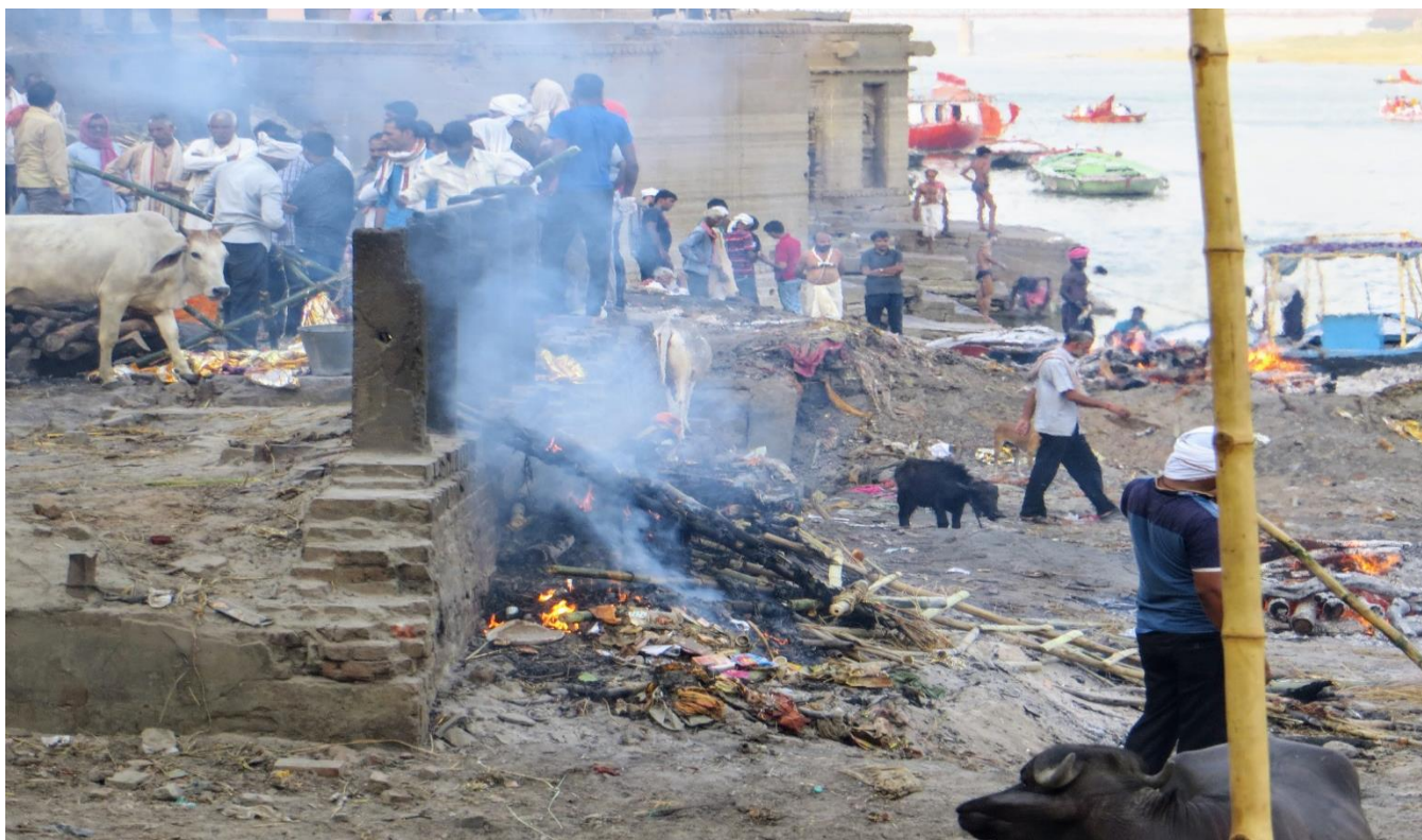
Spaľovací ghát Manikarnika (Janka Onufráková)